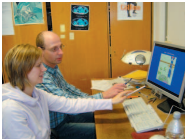
Modellanalyse vorm Computer